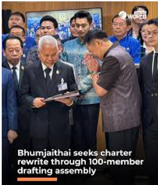
Bhumjaithai seeks charter rewrite through 100-member drafting assembly

(Xinhua) - ອະນຸທິນ ຊານວິຣະກຸນນາຍົກລັດຖະມົນຕີໄທນຳພາພູມໃຈໄທຍື່ນຮ່າງປັບປຸງລັດຖະທຳມະນູນຕໍ່ລັດຖະສະພາ ໃນວັນພຸດທີ່ 20 ພຶດສະພາ, ເຊິ່ງເປັນພັກທຳອິດທີ່ລິເລີ່ມຂະບວນການປັບປຸງລັດຖະທຳມະນູນຢ່າງເປັນທາງການ; ອະນຸທິນ ພ້ອມກັບຄະນະກຳມະການບໍລິຫານພັກ ແລະ ສະມາຊິກສະພາຜູ້ແທນລາດສະດອນຂອງພັກ ໄດ້ຍື່ນຂໍສະເໜີຕໍ່ປະທານສະພາຜູ້ແທນລາດສະດອນໂສຟິນ ຊາຣຳ ໂດຍກຳນົດຂຶ້ນຕອນການຮ່າງສິ່ງທີ່ພັກເອີ້ນວ່າ “ລັດຖະທຳມະນູນຂອງປະຊາຊົນ”.