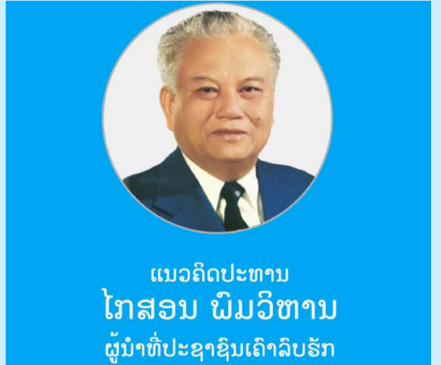
ແນວຄິດປະທານ ໂກສອນ ພິມວິຫານ ຜູ້ນໍາທີ່ປະຊາຊົນເຄົາລົບຮັກ

(ສພຊ) - ໃນລະຫວ່າງວັນທີ 15-19 ເມສາ 2026 ຄະນະຜູ້ແທນສະພາແຫ່ງຊາດລາວ ນໍາໂດຍທ່ານ ນາງ ສຸນທອນ ໄຊຍະຈັກ ຮອງປະທານສະພາແຫ່ງຊາດ ໄດ້ເຂົ້າຮ່ວມກອງປະຊຸມໃຫຍ່ສະຫະພັນລັດຖະສະພາສາກົນ (Inter-Parliamentary Union - IPU) ຄັ້ງທີ 152 ທີ່ນະຄອນອິສຕັນບູນ, ປະເທດຕວັກກີ ເຊິ່ງມີຄະນະຜູ້ແທນຈາກ 126