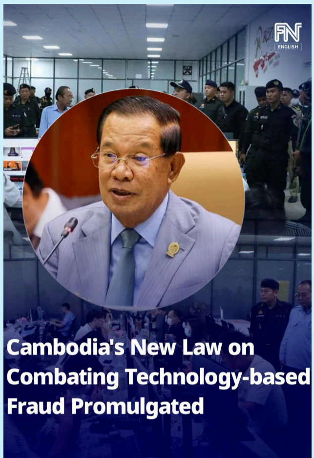
Cambodia's New Law on Combating Technology-based Fraud Promulgated

(Xinhua)-ເນດພຽກ ຕຣາ (Neth Pheaktra) ລັດ ຖະມົນຕີກະຊວງຖະແຫຼງຂ່າວ ກ່າວວ່າ ລັດຖະບານກຳປູເຈຍ ອະນຸມັດຮ່າງກົດໝາຍວ່າດ້ວຍ ການຕໍ່ຕ້ານການຫຼອກລວງທາງ ອອນລາຍ ເມື່ອວັນສຸກທີ່ 13 ມີນານີ້ ເຊິ່ງຈະກຳນົດການລົງ ໂທດຢ່າງຮຸນແຮງຕໍ່ຜູ້ຫຼອກລວງ; ການອະນຸມັດດັ່ງກ່າວ ມີຂຶ້ນລະ ຫວ່າງກອງປະຊຸມຄະນະລັດຖະ ມົນຕີປະຈຳອາທິດ ເຊິ່ງມີນາ ຍົກລັດຖະມົນຕີ ຮຸນ ມາເນັດ (Hun Manet) ເປັນປະທານ.