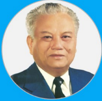
ແນວຄິດປະທານ ໄກສອນ ພິມວິຫານ ຜູ້ນໍາທີ່ປະຊາຊົນເຄົາລົບຮັກ

ການປະຕິວັດຂອງປະເທດເຮົາໃນໄລຍະໃໝ່ນີ້ ແມ່ນໄລຍະແຫ່ງການປັບປຸງ, ຂະຫຍາຍ ແລະ ບູລະນະລະບອບປະຊາທິປະໄຕປະຊາຊົນ ຂ້າມຜ່ານຂັ້ນສູງສິດທິນິຍົມເທື່ອລະກ້າວ. (ນິພົນເລືອກເຝັ້ນ ໜຶ່ງ 3, ໜ້າ 321) ລັກສະນະຜື່ນຖານຂອງການປະຕິວັດປະເທດເຮົາໃນໄລຍະໃໝ່ ແມ່ນລັກສະນະປະຊາທິປະໄຕປະຊາຊົນ ກ້າວຂຶ້ນສັງຄົມນິຍົມເທື່ອລະກ້າວ, ຫາກບໍ່ແມ່ນຂະຫຍາຍຕົວໄປຢູ່ນອກວົງໂຄຈອນຂອງສັງຄົມນິຍົມແຕ່ຢ່າງໃດ. ອັນນີ້ເປັນບັນຫາທີ່ພວກເຮົາຈະຕ້ອງຮັບຮູ້ໃຫ້ຈະແຈ້ງ. (ນິພົນເລືອກເຝັ້ນ ໜຶ່ງ 3, ໜ້າ 322)