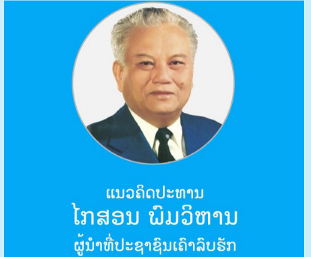
ແນວຄິດປະທານ ໂກສອນ ພິມວິຫານ ຜູ້ນໍາທີ່ປະຊາຊົນເຄົາລົບຮັກ

ໃນຕໍ່ໜ້ານີ້ ພວກເຮົາຕ້ອງຫັນກໍາລັງໄປສູ່ຊົນນະບົດ, ຂຶ້ນໄປເຂດພູດອຍ ແລະ ລົງຮາກຖານ ຄຽງຄູ່ກັບການເປີດກວ້າງການພົວພັນກັບຕ່າງປະເທດ.