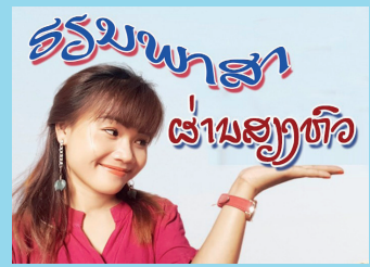
ຮຽນພາສາ ຜ່ານສຽງຫົວ

ສໍາລັບຢູ່ແຫຼ່ງທ່ອງທ່ຽວວັງວຽງຂອງພວກເຮົານັ້ນ ເມື່ອມີເທສະການງານບຸນໃຫຍ່ໂຮງແຮມກໍຈະຂຶ້ນລາຄາຫ້ອງນອນສູງຂຶ້ນ, ເລື່ອງນີ້ຍັງເປັນບັນຫາຖືກຖຽງກັນຢູ່ ວ່າສົມຄວນ ຫຼື ບໍ່, ເພາະແຂກພັກອາດຈະຖືວ່າເປັນການສວຍໂອກາດກໍໄດ້.