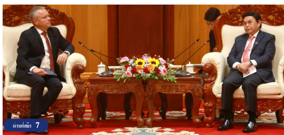
ອ່ານຕໍ່ໜ້າ 7