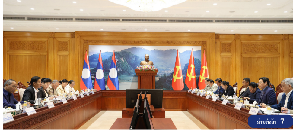
ອ່ານຕໍ່ໜ້າ 7