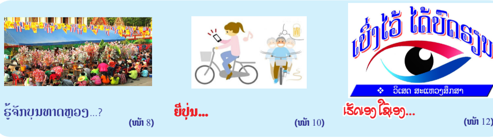
ອ່ານຕໍ່ໜ້າ 6

ພ້ອມດ້ວຍບັນດາທ່ານຕາງໜ້າຈາກກະຊວງ ແລະ ອົງການທີ່ກ່ຽວຂ້ອງ, ພ້ອມທັງຊຽວຊານດ້ານເສດຖະກິດ ຈາກອົງການຈັດຕັ້ງສາກົນ ແລະ ແຂກຖືກເຊີນຈາກພາກສ່ວນຕ່າງໆ ເຂົ້າຮ່ວມຢ່າງຫຼວງຫຼາຍ.