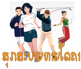
ສຸກສະໄໝທາຍໂລດ