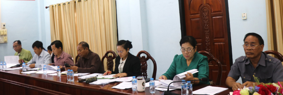
(ສີແຫວງ ສິບຸນເຮືອງ)

ລົງເຈົ້າ ແຂວງ ວ່າດ້ວຍການກຳນົດເຂດສະຫງວນນ້ຳ ແລະ ຊັບພະຍາກອນນ້ຳຢູ່ແຂວງອຸດົມໄຊ; ບົດລາຍງານການປັບປຸງຮ່າງຂໍ້ຕົກລົງເຈົ້າແຂວງ ວ່າດ້ວຍການດຳເນີນທຸລະກິດບໍລິການດ້ານເຕັກໂນໂລຊີການສື່ສານຂໍ້ມູນ-ຂ່າວສານຢູ່ແຂວງອຸດົມໄຊ; ບົດລາຍງານການປັບປຸງຮ່າງຂໍ້ຕົກລົງເຈົ້າແຂວງ ວ່າດ້ວຍການຄຸ້ມຄອງການບໍລິການ, ການກໍ່ສ້າງ ແລະ ຕິດຕັ້ງໄຟຟ້າຢູ່ແຂວງອຸດົມໄຊ; ລາຍງານໂດຍສັງເຂບກ່ຽວກັບການກະກຽມເຄື່ອນໄຫວຕິດຕາມກວດກາການຈັດຕັ້ງປະຕິບັດຍຸທະສາດ ການປະຕິຮູບລະບົບການສຶກສາ ແລະ ການພັດທະນາຊັບພະຍາກອນມະນຸດແຫ່ງຊາດ ໃນໄລຍະຜ່ານມາ ຮ່ວມກັບສະພາແຫ່ງຊາດ; ລາຍງານໂດຍສັງເຂບ ການກະກຽມເຄື່ອນໄຫວຕິດຕາມກວດກາການຈັດຕັ້ງປະຕິບັດການກໍ່ສ້າງ, ບຸລະນະສ້ອມແປງເສັ້ນທາງ ແລະ ການພັດທະນາຂະຫຍາຍໂຄງລ່າງພື້ນຖານທີ່ຈຳເປັນເຊື່ອມຈອດເຂົ້າສູ່ແລວທາງເສດຖະກິດຢູ່ຂອບເຂດທົ່ວປະເທດຮ່ວມກັບສະພາແຫ່ງຊາດ; ຜ່ານຮ່າງບົດສະຫຼຸບປະຈຳເດືອນສິງຫາ ແລະ ທິດທາງແຜນການ ປະຈຳເດືອນກັນຍາ ປີ 2024 ຂອງຄະນະປະຈຳສະພາປະຊາຊົນແຂວງ ແລະ ລາຍງານການປັບປຸງຂໍ້ກຳນົດຊົ່ວຄາວວ່າດ້ວຍລະບຽບ ແລະ ການປະຕິບັດນະໂຍບາຍພາຍໃນ ສະພາປະຊາຊົນແຂວງອຸດົມໄຊ. ພາຍຫຼັງສຳເລັດການລາຍງານຜູ້ເຂົ້າຮ່ວມໄດ້ມີຄຳຄິດຄຳເຫັນ ແລະ ພະແນກພະລັງງານ ແລະ ບໍ່ແຮ່ ທີ່ກ່ຽວຂ້ອງໄດ້ຊີ້ແຈງບາງບັນຫາຕໍ່ກອງປະຊຸມ. ກອງປະຊຸມໄດ້ດຳເນີນເປັນເວລາໜຶ່ງຕອນ.