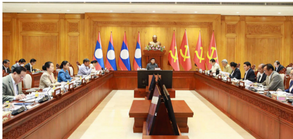
(ສພຊ) - ກອງປະຊຸມ ຄະນະກຳມະການລະດັບຊາດປັບ ຄັ້ງທີ 1 ຂອງຄະນະປະຈຳການ ປຸງລັດຖະທຳມະນູນແຫ່ງສປປ ລາວ ສະບັບປີ 2015 (ຄລຊ) ໄດ້ດຳເນີນໃນຕອນເຊົ້າວັນທີ 7

ສິງຫານີ້ ພາຍໃຕ້ການເປັນປະທານຂອງທ່ານປອ. ໄຊສິມພອນ ພິມວິຫານ ກຳມະການກົມການເມືອງສູນກາງພັກ, ປະທານສະພາແຫ່ງຊາດ, ປະທານຄະນະກຳມະການລະດັບຊາດປັບປຸງລັດຖະທຳມະນູນ; ເຂົ້າຮ່ວມມີບັນດາທ່ານຮອງປະທານ ແລະ ກຳມະການ ຄລຊ, ຄະນະອະນຸກຳມະການຕ່າງໆ ແລະ ກອງເລຂາ. ຈຸດປະສົງແມ່ນເພື່ອສະ