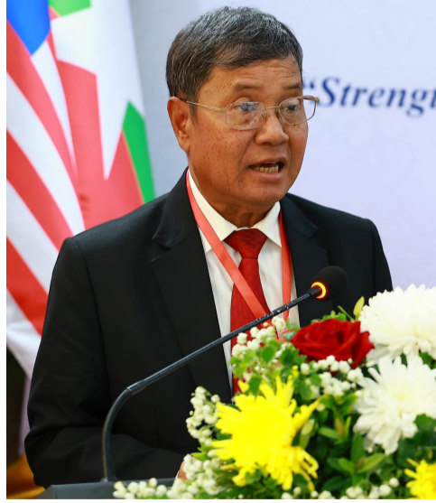
ເຫຼົາລູກໜ້າເຕັມ (ໜ້າ 9)

(ສພຊ) - ເພື່ອປະຕິບັດແນວທາງການຕ່າງປະເທດສັນຕິພາບ, ເອກະລາດ, ມິດຕະພາບ ແລະ ການຮ່ວມມືເພື່ອການພັດທະນາ, ຮັດເປັນຮູບປະທັບ (Strengthening