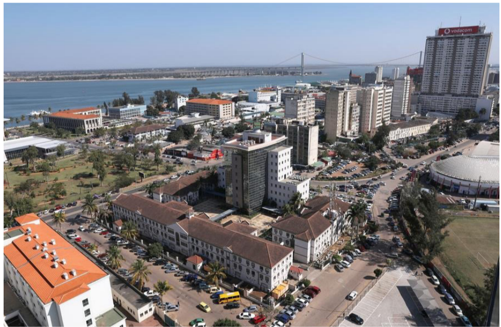
ທິວທັດນະຄອນຫຼວງມາປູໂຕ (27/7/2023)

ວັນທີ 7 ສິງຫາຜ່ານມາ, ຄະນະກຳມະການການເລືອກຕັ້ງແຫ່ງຊາດໂມຊຳບິກ (CNE) ໄດ້ປະກາດຕຳແໜ່ງ ຂອງພັກການເມືອງໃນບັດລົງຄະແນນສຳລັບການເລືອກຕັ້ງເດືອນຕຸລາ ໂດຍຂະບວນການປະຊາທິປະໄຕແຫ່ງໂມຊຳບິກ (MDM) ຢູ່ອັນດັບໜຶ່ງ, ແນວໂຮມປັດປ້ອຍໂມຊຳບິກ (FRELIMO) ພັກລັດຖະບານບັດຈຸບັນ ຢູ່ທີ່ສອງ ແລະ ການຕໍ່ຕ້ານແຫ່ງຊາດໂມຊຳບິກ (RENAMO) ພັກຝ່າຍຄ້ານຕົ້ນຕໍ ຢູ່ທີ່ສາມ.