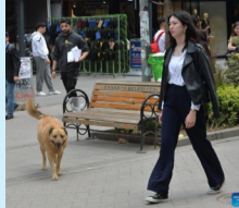
ສະພາແຫ່ງຊາດ... (ໜ້າ 11)