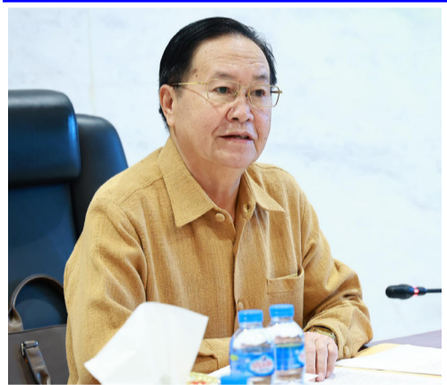
(ສພຊ) - ເພື່ອເປັນເອກະພາບກະກຽມໃຫ້ແກ່ກອງປະຊຸມຄົບຄະນະກຳມະການລະດັບ

ຊາດປັບປຸງລັດຖະທຳມະນູນ ສະບັບປີ 2015 (ຄລຊ) ໃນທ້າຍເດືອນສິງຫານີ້, ຕອນປ່າຍວັນທີ 12 ສິງຫາ 2024 ທີ່ສະພາແຫ່ງຊາດ (ສພຊ) ໄດ້ມີກອງປະຊຸມແລກປ່ຽນຄວາມ ຊຸມຄົບຄະນະກຳມະການລະດັບ ເຫັນກ່ຽວກັບໂຄງສ້າງລັດຖະທຳມະນູນສະບັບປັບປຸງໃໝ່ ໂດຍການເປັນປະທານຂອງທ່ານ ສຈ. ປອ. ຈະເລີນ ເຍຍປາວເຮີ ຮອງປະທານສະພາແຫ່ງຊາດ, ຮອງປະທານ ຜູ້ປະຈຳການຄະນະກຳມະການລະດັບຊາດປັບປຸງລັດຖະທຳມະນູນ; ມີບັນດາທ່ານກຳມະການ ຄລຊ, ຄະນະອະນຸກຳມະການຕ່າງໆ ແລະ ກອງເລຂາພ້ອມດ້ວຍຊ່ຽວຊານ, ພະນັກງານອາວຸໂສບ້ານນາຂອງ