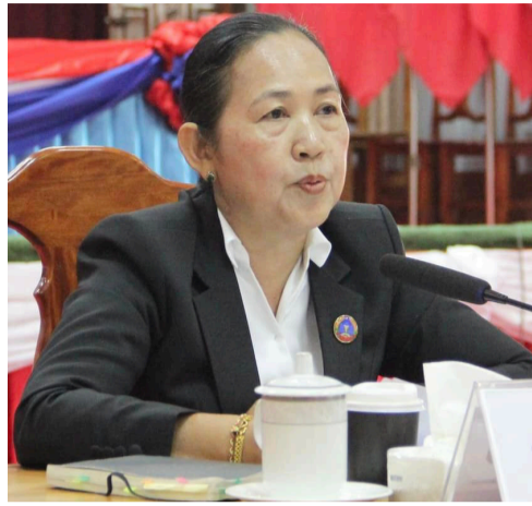
(ສພຊ) - ກອງປະຊຸມ

ເຝິກອົບຮົມສ້າງຄວາມເຂັ້ມແຂງໃຫ້ແກ່ສະມາຊິກສະພາແຫ່ງຊາດ (ສສຊ) ທີ່ເປັນກຳມະການຂອງກຳມາທິການເສດຖະກິດ, ເຕັກໂນໂລຊີ ແລະ ສິ່ງແວດລ້ອມ (ກສຕສ), ສະມາຊິກສະພາປະຊາຊົນແຂວງ (ສສຂ) ໃນຂົງເຂດເສດຖະກິດແລະວິຊາການຊ່ວຍວຽກຂອງກຳມາທິການກສຕສ, ເສນາທິການຊ່ວຍວຽກຂອງຄະນະກຳມະການເສດຖະກິດ, ແຜນການ ແລະ ການເງິນຂອງສະພາປະຊາຊົນແຂວງ (ສພຂ) 7 ແຂວງ: ບໍລິຄໍາໄຊ, ຄຳມ່ວນ, ສະຫວັນນະເຂດ, ສາລະວັນ, ເຊກອງ, ຈຳປາສັກແລະອັດຕະປື ໄດ້ຈັດຂຶ້ນໃນວັນທີ 15-16 ກໍລະກົດ 2024 ທີ່ເມືອງປາກຊອງ ແຂວງຈຳປາສັກ ໂດຍການເປັນປະທານຂອງທ່ານນາງ ປິງຄຳ ລາຊະສີມາ, ປະທານກຳມາທິການເສດຖະກິດ, ເຕັກໂນໂລຊີ ແລະ ສິ່ງແວດລ້ອມ; ເຂົ້າຮ່ວມມີປະທານ ແລະ ຮອງປະທານ ສພຂ ຈຳປາສັກ, ຄະນະຮັບຜິດຊອບແລະພາກສ່ວນທີ່ກ່ຽວຂ້ອງ.