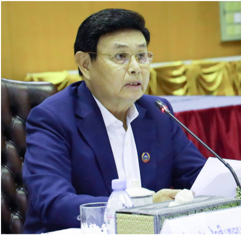
(ສພຊ) - ກອງປະຊຸມ ປະເມີນການຈັດຕັ້ງປະຕິບັດລັດ ຖະທໍາມະນູນ ແຫ່ງ ສປປ ລາວ

ສະບັບປີ 2015 ໄດ້ ຈັດຂຶ້ນໃນ ວັນທີ 20 ມິ ຖຸນາ 2024 ທີ່ສູນເຝິກ ອົບຮົມ ແລະ ການຮ່ວມ ມືສາກົນ (ICTC) ໂດຍການ ເປັນປະທານ