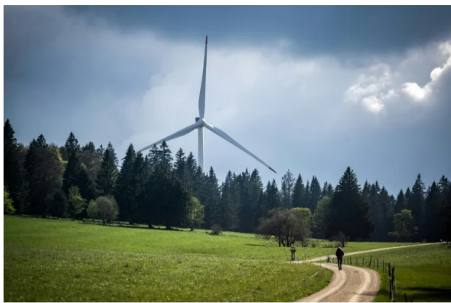
Court of Human Rights - ECHR).

ກົດໝາຍຜະລັງງານທົດແທນໄດ້ຮັບການອະນຸມັດຈາກລັດຖະສະພາສະວິດເມື່ອປີຜ່ານມາ ແລະ ອີງການຈັດຕັ້ງດ້ານການຜະລິດຜະລັງງານນໍ້າ ເພື່ອເຮັດໃຫ້ປະເທດທີ່ຮັ່ງມີທີ່ບໍ່ມີຊາຍແດນຕິດກັບທະເລ ຫຼຸດຜ່ອນການເພິ່ງພາອາໄສໄຟຟ້າທີ່ນໍ້າເຂົ້າ.