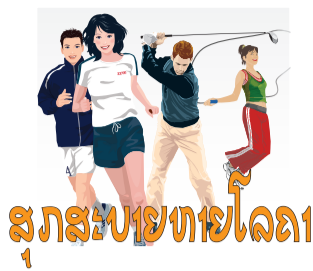
ສູງຂອງສະພາແຫ່ງຊາດ