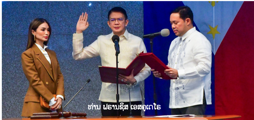
ທ່ານ ຟຣານຊີສ ເອສຄູເດໂຣ

ຕາມເວັບໄຊຂ່າວສານ ຊິນຮວາ, ເມື່ອວັນຈັນທີ 20 ພຶດສະພາຜ່ານມາ, ທ່ານ ຮວນ ມິເກວ ຊຸບິຣີ (Juan Miguel Zubiri) ປະທານສະພາສູງຟີລິບປິນ ຍືນຍັນການລາອອກຈາກ ຕໍາແໜ່ງ, ທ່ານ ຟຣານຊີສ ເອສຄູເດໂຣ (Francis Escudero) ໄດ້ສາບານຕົນຂຶ້ນຮັບຕໍາແໜ່ງ ເປັນຫົວໜ້າອົງການນິຕິບັນຍັດ ຄົນໃໝ່.