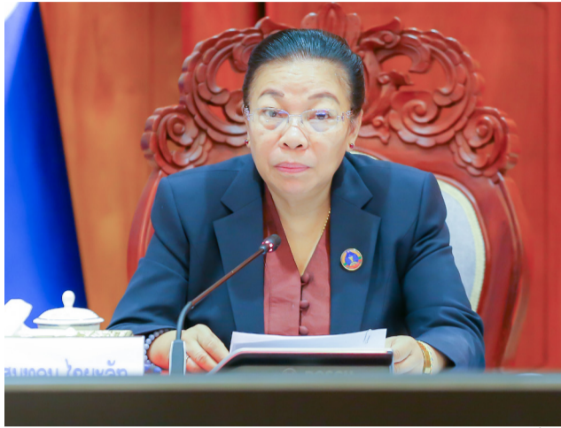
ກອງປະຊຸມຕິດຕາມ ກວດກາຂອງຄະນະປະຈຳສະພາ ແຫ່ງຊາດ ກ່ຽວກັບການປະຕິ ບັດຄໍາຕັດສິນຂອງສານຢູ່ຂັ້ນ ສູນກາງຄັ້ງນີ້ ໄດ້ຈັດຂຶ້ນໂດຍ ການເປັນປະທານຂອງທ່ານ ປອ.

(ສພຊ) - ປະຕິບັດຕາມ ພາລະບົດບາດຂອງສະພາແຫ່ງ ຊາດໃນການຕິດຕາມກວດກາ, ໃນວັນທີ 09 ພຶດສະພາ 2024 ສະພາແຫ່ງຊາດໄດ້ຈັດກອງປະ ຊຸມເພື່ອຕີລາຄາການຈັດຕັ້ງປະ ຕິບັດກົດໝາຍວ່າດ້ວຍການປະ ຕິບັດຄໍາຕັດສິນຂອງສານ ສະບັບ ປັບປຸງປີ 2021 ແນໃສ່ຮັບປະ ກັນເຮັດໃຫ້ຄໍາຕັດສິນຂອງສານ ໃຊ້ໄດ້ຢ່າງເດັດຂາດ, ເຂັ້ມງວດ, ຄົບຖ້ວນ, ຖືກຕ້ອງຕາມຄໍາຕັດ ສິນຂອງສານ ແລະ ຕາມກົດ ໝາຍທີ່ກຳນົດໄວ້.