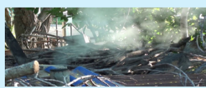
ເຜົາ... (ໜ້າ 9)