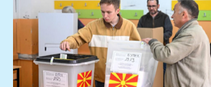
ພັກ VMRO-DPMNE... (ໜ້າ 11)