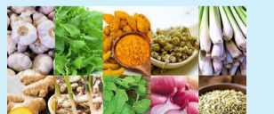
5 ສະໝຸນໄຟ... (ໜ້າ 10)