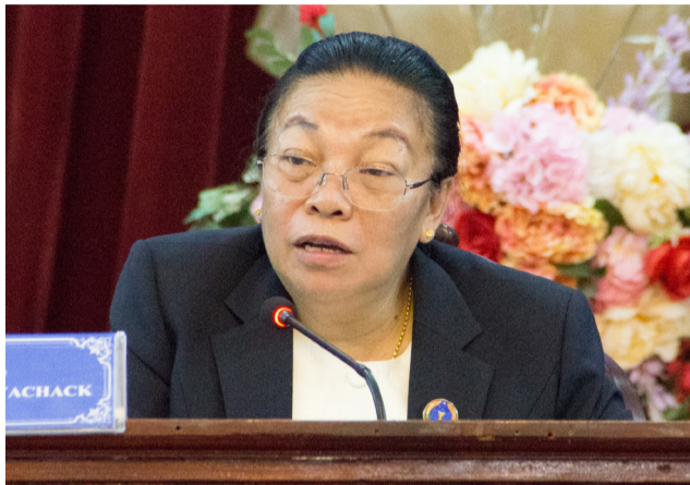
ສປປລາວ ຕາມຄໍາເຊີນຂອງຄະ ຜເພດຍິງ ສປປລາວ; ການມາຢ້ຽມ ນະສະມາຊິກສະພາແຫ່ງຊາດ ຢາມ ແລະ ເຮັດວຽກຂອງຄະນະ

(ສພຊ) - ໃນລະຫວ່າງ ວັນທີ 24-27 ເມສາ 2024 ຄະນະຜູ້ແທນສະມາຊິກສະພາ ແຫ່ງຊາດ (ສສຊ) ເພດຍິງ ແຫ່ງ ສສ.ຫວຽດນາມ ນໍາໂດຍສະ ຫາຍ ນາງ ຫງວຽນ ຖຸຍ ແອັງ (Nguyễn Thúy Anh) ກໍາ ມະການສູນກາງພັກກອມມູນິດ ຫວຽດນາມ, ຄະນະປະຈຳສະພາ ແຫ່ງຊາດ, ປະທານກໍາມາທິການ ສັງຄົມ, ປະທານຄະນະສະມາຊິກ ສະພາແຫ່ງຊາດເພດຍິງ ໄດ້ມາ ຢ້ຽມຢາມ ແລະ ເຮັດວຽກຢູ່