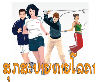
ສຸກສະບຍໂຫຍໂລດ

ເຊື່ອວ່າຫຼາຍຄົນຮູ້ຈັກໃບເຕີຍ ມີເອກະລັກສະເພາະ ແລະ ເປັນພືດທີ່ພົບເຫັນຫຼາຍຢູ່ຕາມບ້ານເຮືອງ ແລະ ຍັງເປັນພືດທີ່ປຸກງ່າຍນຳອີກ. ໃບເຕີຍ ບໍ່ພຽງແຕ່ສາມາດນຳມາປະກອບປຸງແຕ່ງອາຫານໄດ້ແຕ່ຫາກຍັງເປັນສະໜູນໄພນຳອີກ ເຊິ່ງຄຸນປະໂຫຍດຂອງໃບເຕີຍນັ້ນປະກອບດ້ວຍ 7 ຢ່າງລຸ່ມນີ້: