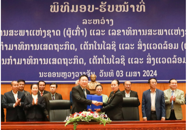
ຊາດ (ຄປຈສພຊ). ເຂົ້າຮ່ວມມີ ທ່ານກໍາມາທິການ, ຮອງເລຂາທິການສະພາແຫ່ງຊາດ ແລະ ບັນດາທ່ານຮອງປະທານ ແລະ ກໍາມະການຄປຈສພຊ; ຮອງປະທານກໍາມາທິການ, ຮອງເລຂາທິການສະພາແຫ່ງຊາດ (ຜູ້ເກົ່າ) ແລະ ເລຂາທິການສະພາແຫ່ງຊາດ (ຜູ້ໃໝ່) ກໍາມາທິການເສດຖະກິດ, ເຕັກໂນໂລຊີ ແລະ ສິ່ງແວດລ້ອມ (ກສຕສ) ກໍາມາທິການເສດຖະກິດ, ເຕັກໂນໂລຊີ ແລະ ສິ່ງແວດລ້ອມ (ກສຕສ) ນະຄອນຫຼວງວຽງຈັນ, ວັນທີ 03 ເມສາ 2024

(ສພຊ) - ໃນຕອນບ່າຍຂອງວັນພຸດທີ 03 ເມສາ 2024 ທີ່ສະພາແຫ່ງຊາດ ໄດ້ຈັດພິທີມອບ-ຮັບໜ້າທີ່ລະຫວ່າງເລຂາທິການສະພາແຫ່ງຊາດ ຜູ້ເກົ່າກັບ ຜູ້ໃໝ່ ແລະ ປະທານກໍາມາທິການເສດຖະກິດ, ເຕັກໂນໂລຊີ ແລະ ສິ່ງແວດລ້ອມ (ກສຕສ) ຜູ້ເກົ່າ ກັບ ຜູ້ໃໝ່; ໂດຍການເປັນປະທານຂອງທ່ານ ປອ. ນາງ ສຸນທອນ ໄຊຍະຈັກ ເລຂາທິການສູນກາງພັກ, ຮອງປະທານຄະນະປະຈໍາສະພາແຫ່ງຊາດ