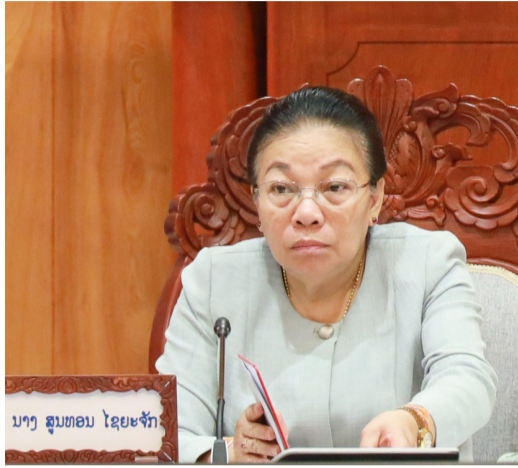
ສ່ວນທີ່ກ່ຽວຂ້ອງ. ກອງປະຊຸມໄດ້ຮັບຝັງການສະເໜີພິຈາລະນາ

(ສພຊ) - ກອງປະຊຸມຄະນະປະຈໍາສະພາແຫ່ງຊາດ ປະຈໍາເດືອນມີນາ 2024 ໄດ້ດໍາເນີນໃນລະຫວ່າງວັນທີ 02-03 ເມສານີ້ ໂດຍການເປັນປະທານຂອງທ່ານ ປອ. ນາງ ສຸນທອນ ໄຊຍະຈັກ ເລຂາທິການສູນກາງພັກ, ຮອງປະທານຄະນະປະຈໍາສະພາແຫ່ງຊາດ; ເຂົ້າຮ່ວມມີບັນດາທ່ານຮອງປະທານ ແລະກໍາມະການຄະນະປະຈໍາສະພາແຫ່ງຊາດ ພ້ອມດ້ວຍພາກ