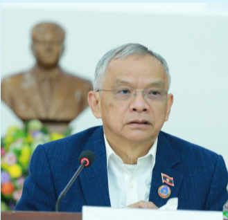
ເຂົ້າຮ່ວມມີບັນດາທ່ານ ສສຊ ປະຈໍາເຂດເລືອກຕັ້ງ, ສະມາຊິກ ສະພາປະຊາຊົນແຂວງ (ສສຂ) ພ້ອມດ້ວຍບັນດາທ່ານການນໍາ ພັກ-ລັດຂັ້ນແຂວງ, ຫົວໜ້າ-

(ສພຊ) ລະຫວ່າງວັນທີ 18-19 ມີນາ 2024 ທີ່ສະພາ ປະຊາຊົນແຂວງ(ສພຂ)ຫົວພັນ ແລະ ລະຫວ່າງວັນທີ 21-22 ມີນາ2024ທີ່ສພຂ ຊຽງຂວາງ ໄດ້ຈັດກອງປະຊຸມທາບທາມຮ່າງ ກົດໝາຍ 3 ສະບັບ ໃນຂົງເຂດ ສະພາແຫ່ງຊາດ (ສພຊ) ໂດຍ ການເປັນປະທານຮ່ວມຂອງທ່ານ ສສຊ ສິມມາດ ພິລເສນາ ຮອງປະທານ ສະພາແຫ່ງຊາດ ແລະ ປະທານ ຄະນະສະມາຊິກສະພາແຫ່ງຊາດ (ສສຊ) ປະຈໍາເຂດເລືອກຕັ້ງ;