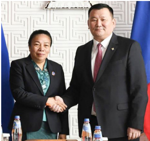
ອໍາກາລັງສະມາຊິກສະພາຄູຣານ ໃຫຍ່, ປະທານຄະນະມິດຕະພາບ ໃຫຍ່, ປະທານກໍາມາທິການ ຄວາມໝັ້ນຄົງ ແລະ ນະໂຍບາຍ ຕ່າງປະເທດຂອງສະພາຄູຣານ