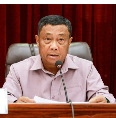
ໝາຍທີ່ກຳນົດໄວ້; ເພື່ອເປັນຂໍ້ ມູນພື້ນຖານກະກຽມລາຍງານຕໍ່ ກອງປະຊຸມຄະນະປະຈໍາສະພາ

(ສພຊ) ເພື່ອຕິດຕາມ ການຈັດຕັ້ງປະຕິບັດກົດໝາຍວ່າ ດ້ວຍການປະຕິບັດຄໍາຕັດສິນ ຂອງສານ ສະບັບປັບປຸງປີ 2021 ທັງເປັນການເພີ່ມທະວີການຕິດ ຕາມກວດກາ ແລະ ຊຸກຍູ້ການ ຈັດຕັ້ງປະຕິບັດຄໍາຕັດສິນຂອງ ສານ ແນໃສ່ຮັບປະກັນເຮັດໃຫ້ ຄໍາຕັດສິນຂອງສານທີ່ໃຊ້ໄດ້ຢ່າງ ເດັດຂາດ ໄດ້ຮັບການປະຕິບັດ ຢ່າງເຂັ້ມງວດ, ຄົບຖ້ວນ, ຖືກ ຕ້ອງຕາມຄໍາຕັດສິນ ແລະ ກົດ