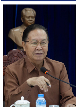
(ສພຊ) ສະພາແຫ່ງຊາດ (ສພຊ) ຊຸດທີ IX ໄດ້ມີແຜນ ປັບປຸງກົດໝາຍຂົງເຂດສະພາ ແຫ່ງຊາດຮັບຜິດຊອບ ແລະ ຈະ ນໍາເຂົ້າຝຶຈາລະນາຮັບຮອງໃນ ກອງປະຊຸມສະໄໝສາມັນແຕ່ລະ

ຄັ້ງແນໃສ່ປັບປຸງເຄື່ອງມືສໍາຄັນ ໃຫ້ແກ່ການເຄື່ອນໄຫວຂອງ ສພຊ ແລະ ສະພາປະຊາຊົນຂັ້ນ ແຂວງ (ສພຂ) ໃນຕໍ່ໜ້າໃຫ້ ເປັນລະບົບ, ຄົບຖ້ວນ, ຮັດກຸມ ແລະ ສາມາດປະຕິບັດໄດ້ຢ່າງມີ ປະສິດທິພາບ, ປະສິດທິຜົນ.