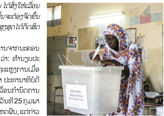
ໄຂບໍ່ສອດຄ່ອງກັບກົດໝາຍ.

ການເຄື່ອນໄຫວດັ່ງກ່າວຂອງຜູ້ນໍາເຊເນການ ທີ່ດໍາລົງຕໍາແໜ່ງສອງສະໄໝຕິດຕໍ່ກັນ ແລະ ຍືນຍັນວ່າຈະບໍ່ລົງສະໝັກຮັບເລືອກຕັ້ງອີກ ເກີດຂຶ້ນພຽງສອງສາມຊົ່ວໂມງກ່ອນບັນດາຝັກການເມືອງຈະເລີ່ມດໍາເນີນການໂຄສະນາຫາສຽງຢ່າງເປັນທາງການ ທ່າມກາງການຂັດແຍ່ງ ແລະ ຂໍ້ໂຕ້ຖຽງກັນລະຫວ່າງສານລັດຖະທໍາມະນູນ ກັບ ສະພາແຫ່ງຊາດ ຈາກການທີ່ສານໄດ້ຕັດສິດຜູ້ສະໝັກປະມານ 20 ຄົນ, ໃນນັ້ນ ສ່ວນໃຫຍ່ແມ່ນນັກການເມືອງຝ່າຍຄ້ານ ວ່າມາດຕະຖານ ແລະ ເງື່ອນ