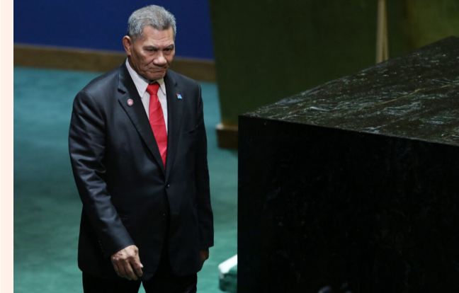
ທ່ານນາຍົກລັດຖະມົນຕີ ເຄົາຊີ ນາຕາໂນ

ນາຍົກລັດຖະມົນຕີຕູວາ ລູ ເຊິ່ງມີຈຸດເຍື່ອສະໜັບສະໜູນ ໄດ້ທວນ ພ່າຍແພ້ການເລືອກຕັ້ງ ທົ່ວໄປ, ການເຄື່ອນໄຫວທີ່ຫຼາຍ ຝ່າຍຊື່ວ່າອາດຈະນຳໄປສູ່ການ ປ່ຽນແປງສາຍພົວພັນທາງການ ທຸດລະຫວ່າງລັດຖະບານຕູວາລູ ກັບໄຕ້ຫວັນ. ສຳນັກຂ່າວ AFP ລາຍ ງານຈາກເມືອງຊິດນີ, ປະເທດ ອິດສະຕາລີ ເມື່ອວັນທີ 27 ມັງກອນ 2024 ວ່າ: ຄະນະກຳ ມະການການເລືອກຕັ້ງຂອງຕູວາ ລູ (Tuvalu) ປະເທດໜູ່ເກາະ ຂະໜາດນ້ອຍໃນມະຫາສະໝຸດ ປາຊີຟິກ ເຊິ່ງມີປະຊາກອນປະ ມານ 11.900 ຄົນ ໄດ້ປະກາດ ຜົນຂອງການເລືອກຕັ້ງສະມາຊິກ ສະພາແຫ່ງຊາດຊຸດໃໝ່ທັງໝົດ 16 ທີ່ນັ້ງ ຫຼັງຈາກການລົງຄະ ແນນສຽງເລືອກຕັ້ງເມື່ອວັນສຸກ ທີ່ 26 ມັງກອນທີ່ຜ່ານມາດ້ວຍ ຜູ້ມີສິດເລືອກຕັ້ງປະມານ 6.000