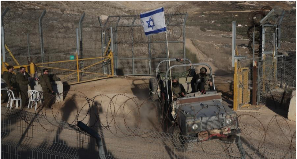
ທະຫານອິດສະຣາແອນຖືກພິບເຫັນຢູ່ໃກ້ເຂດກັນຊິນໃນເຂດທີ່ຮາບສູງໂກລັນ, 15 ທັນວາ 2024

ໃນຂະນະທີ່ສະຫະລັດເອີ້ນຕົນເອງວ່າເປັນຜູ້ໄກ່ແກ່ຍໃນການຢຸດຍິງຢູ່ເຂດກາຊາ, ແຕ່ໄດ້ໃຊ້ລັດຄັດຄ້ານຮ່າງມະຕິຂອງສະພາຄວາມໝັ້ນຄົງແຫ່ງ ສປຊ ທີ່ຮຽກຮ້ອງໃຫ້ຢຸດຍິງຢູ່ເຂດກາຊາໂດຍທັນທີ ແລະ ບໍ່ມີເງື່ອນໄຂ ຫຼາຍຄັ້ງ.