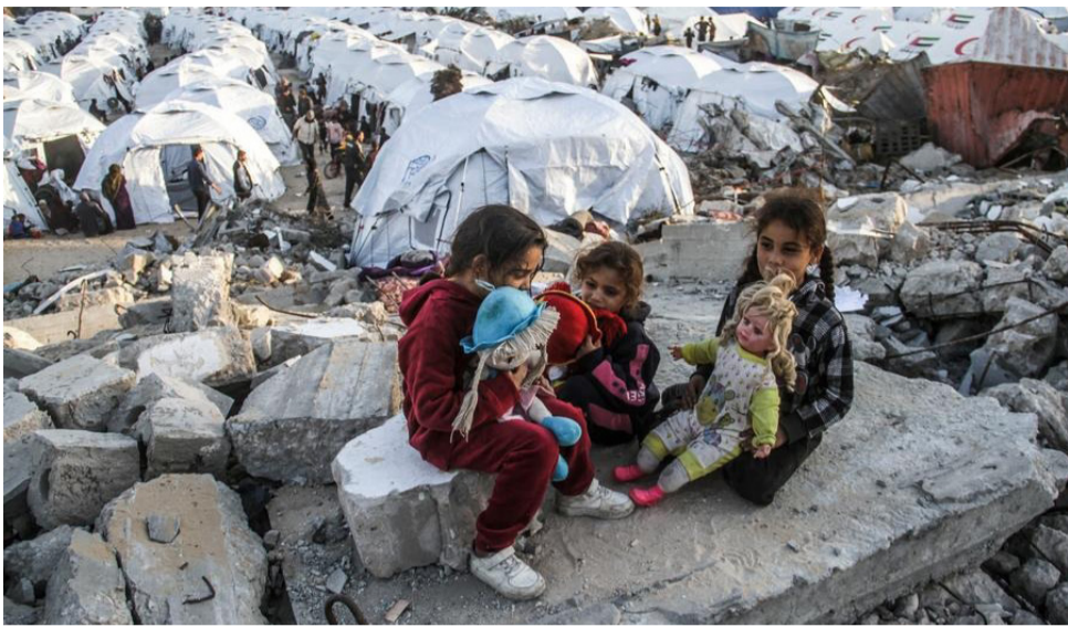
ເດັກນ້ອຍຊາວປາແລັດສະຕິນທີ່ອົບພະຍົບ ກຳລັງຫຼິ້ນຢູ່ບ່ອນລົ້ມໃນເມືອງກາຊາ, 9 ທັນວາ 2024

“ປັດຈຸບັນ, ຕາເວັນອອກກາງແມ່ນສະໜາມຮົບຂອງອິດສະຣາແອນ ເຊິ່ງປະເຊີນໜ້າກັນທາງທະຫານຫຼາຍຄັ້ງ,” ສະຖາບັນຄົ້ນຄວ້າ Carnegie Endowment for International Peace ທີ່ຕັ້ງຢູ່ນະຄອນຫຼວງວໍຊິງຕັນ ກ່າວເມື່ອກາງເດືອນພະຈິກ 2024 ແລະ ກ່າວຕື່ມວ່າ: ນາຍົກລັດຖະມົນຕີເບນຈາມິນ ເນທັນຢາຮູ (Benjamin Netanyahu) ຂອງອິດສະຣາແອນ ແລະ ຜົນທະມິດຂອງເຂົາ “ເບິ່ງຄືວ່າມີຄວາມເດັດດ່ຽວທີ່ຈະຮັກສາຄວາມຂັດແຍ້ງເຫຼົ່ານີ້ໄວ້... ປະຕິເສດການເຈລະຈາ ແລະ ການ