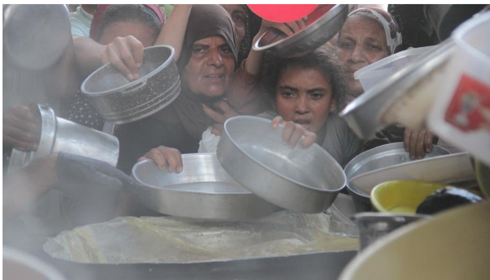
ປະຊາຊົນພະຍາຍາມຮັບເອົາອາຫານບັນເທົາທຸກໃນຄ້າຍຜູ້ລີ້ໄພຈາບາລີ (Jabalía) ທາງເໜືອຂອງເຂດກາຊາ, 29 ສິງຫາ 2024