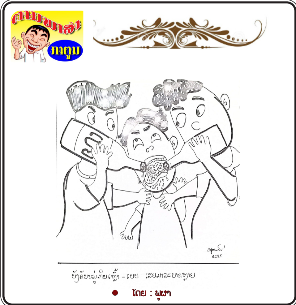
ບັງຄັບໝູ່ກັນເຫຼົ້າ - ເປຍ ເສຍມາລະປາດຫຼາຍ ໂດຍ : ພູຜາ

7. ສືບຕໍ່ເປັນເຈົ້າການໃນການປັບປຸງກົງຈັກການຈັດຕັ້ງໃຫ້ມີຄວາມກະທັດຮັດ, ມີຄຸນນະພາບສາມາດຮອງຮັບກັບໜ້າທີ່ການເມືອງໃນໄລຍະໃໝ່. ນອກນັ້ນ, ທ່ານຮອງປະທານສະພາແຫ່ງຊາດຍັງໄດ້ເນັ້ນໜັກບາງວຽກງານບໍລິຫານ, ຜົນການ, ການເງິນ, ວຽກງານສື່ມວນຊົນ ເຊິ່ງເປັນບັນດາໜ້າວຽກຕົ້ນຕໍຂອງຄະນະເລຂາທິການສະພາແຫ່ງຊາດ ແລະ ສະພາປະຊາຊົນຂັ້ນແຂວງ.