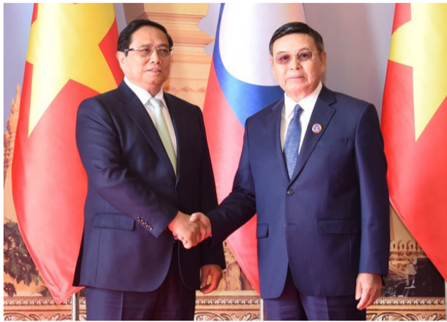
47 ຂອງຄະນະກໍາມະການຮ່ວມ ບານລາວ-ຫວຽດນາມທີ່ຈັດຂຶ້ນ ມີທະວີພາຄິລະຫວ່າງສອງລັດຖະ ໃນວັນທີ 9 ມັງກອນຜ່ານມາ.

(ສພຊ) - ຕອນບ່າຍວັນສຸກທີ 10 ມັງກອນນີ້ ທີ່ສະພາແຫ່ງຊາດ, ສະຫາຍ ປອ. ໄຊສິມພອນ ພົມວິຫານ ກໍາມະການກົມການເມືອງສູນກາງພັກ, ປະທານສະພາແຫ່ງຊາດ ໄດ້ພົບປະກັບສະຫາຍ ຝ່າມ ມິ່ງ ຈິງ ກໍາມະການກົມການເມືອງສູນກາງພັກ ກອມມູນິດຫວຽດນາມ, ນາຍົກລັດຖະມົນຕີ ພ້ອມດ້ວຍຄະນະຜູ້ແທນຂັ້ນສູງຂອງ ສສ.ຫວຽດນາມ ໃນໂອກາດມາຢ້ຽມຢາມ ແລະເຂົ້າຮ່ວມກອງປະຊຸມຄັ້ງທີ