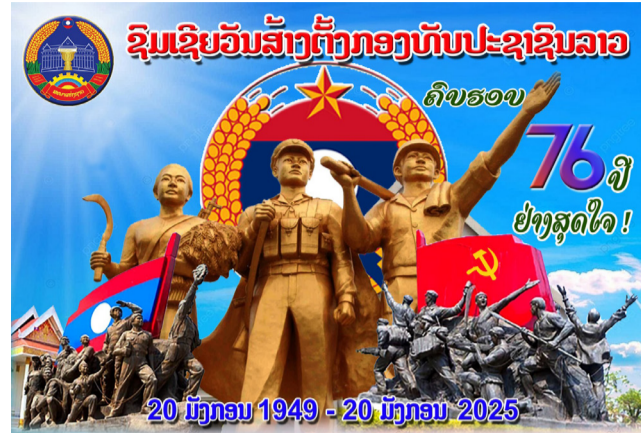
ຊົມເຊີຍວັນສ້າງຕັ້ງກອງທັບປະຊາຊົນລາວ ຄົບຮອບ 76 ປີ ຢ່າງສຸດໃຈ! 20 ມັງກອນ 1949 - 20 ມັງກອນ 2025