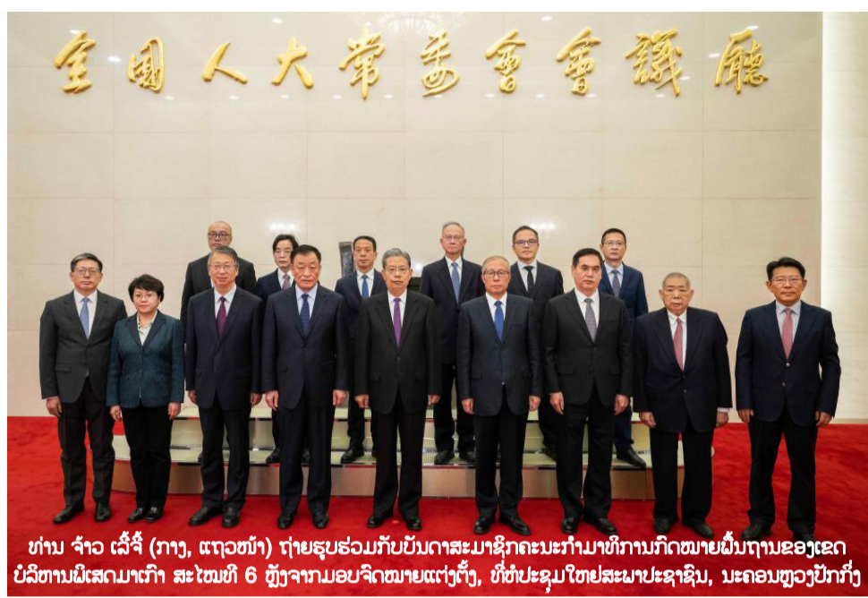
ທ່ານ ຈ້າວ ເລີ້ຈີ້ (ກາງ, ແຖວໜ້າ) ຖ່າຍຮູບຮ່ວມກັບບັນດາສະມາຊິກຄະນະກຳມາທິການກົດໝາຍພື້ນຖານຂອງເຂດບໍລິຫານພິເສດມາເກົາ ສະໄໝທີ 6 ຫຼັງຈາກມອບຈິດໝາຍແຕ່ງຕັ້ງ, ທີ່ຫໍປະຊຸມໃຫຍ່ສະພາປະຊາຊົນ, ນະຄອນຫຼວງປັກກິ່ງ

(Xinhua) - ເມື່ອວັນພຸດທີ 25 ທັນວາຜ່ານມາ, ຄະນະປະຈຳສະພາຜູ້ແທນປະຊາຊົນທົ່ວປະເທດຈີນ (National People's Congress - NPC) ຊຸດທີ XIV ໄດ້ບິດກອງປະຊຸມສະໄໝທີ 13 ພາຍຫຼັງທີ່ດຳເນີນມາແຕ່ວັນທີ 21 ທັນວາ ໂດຍການເປັນປະທານຂອງທ່ານ ຈ້າວ ເລີ້ຈີ້ (Zhao Leji) ປະທານຄະນະປະຈຳ NPC.