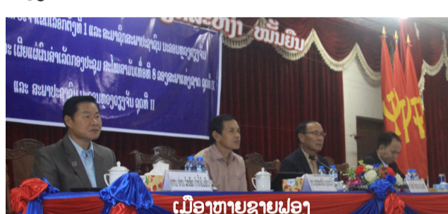
ເມືອງຫາຍຊາຍຝອງ

(ສັງລວມຈາກເລຂ ໜສພ. ວຽງຈັນໃໝ່ ແລະ ປະຊາຊົນ)