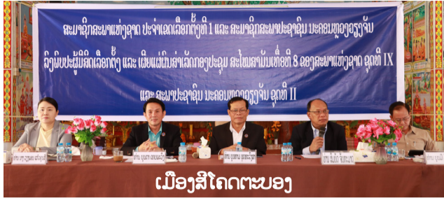
ເມືອງສີໂຄດຕະບອງ

ໜອງດາ ເມືອງສີໂຄດຕະບອງ; ທ່ານ ນາງ ວິໄຊ ສຣິດທິຣາດ