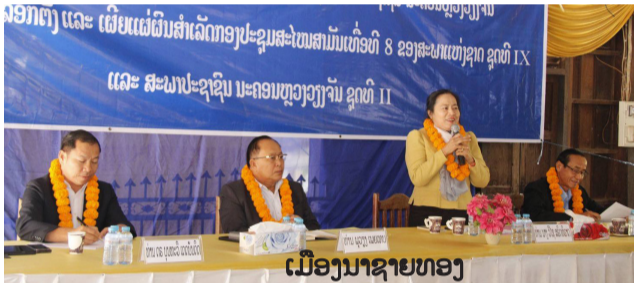
ເມືອງນາຊາຍທອງ

ທ່ານບຸນຕາເທບພະວິງ ປະທານກຳມາທິການວັດທະນະທຳ-ສັງຄົມແລະທ່ານບຸນທາມພຸດທະວິງສາ ຮອງປະທານສະພາ