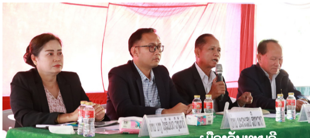
ເມືອງຈັນທະບູລີ

ໃນການເຄື່ອນໄຫວ, ສສຊ ແລະ ສສນວ ໄດ້ຜັດປ່ຽນກັນເຜີຍແຜ່ຜົນສຳເລັດກອງປະຊຸມສະໄໝສາມັນເທື່ອທີ 8 ຂອງສພຊ ຊຸດທີ IX ແລະ ສປນວ ຊຸດທີ II ກໍ່ຄືບັນດາບັນຫາສຳຄັນຕ່າງໆທີ່ໄດ້ຝ່າຍລະນາ ແລະ ຮັບ