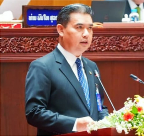
(ສພຊ) - ວັນທີ 5 ທັນ

ວາຜ່ານມາ, ກອງປະຊຸມສະໄໝ ສາມັນເທື່ອທີ 8 ຂອງສະພາແຫ່ງ ຊາດຊຸດທີ IX ໂດຍການເປັນ ປະທານຂອງທ່ານ ສຈ. ປອ. ຈະ ເລີນ ເຍຍປາວເຮີ ຮອງປະທານ ສະພາແຫ່ງຊາດ, ທ່ານ ໄຊ ຊະນະ ໂຄດພູທອນ ຫົວໜ້າອົງ ການໄອຍະການປະຊາຊົນສູງສຸດ ໄດ້ສະເໜີປັບປຸງກົດໝາຍວ່າ ດ້ວຍອົງການໄອຍະການປະຊາ ຊົນເຊິ່ງທ່ານໃຫ້ຮູ້ວ່າ: ຜ່ານການ ຈັດຕັ້ງປະຕິບັດ ກໍຍັງມີບາງບັນ ຫາ ຫຼື ບາງມາດຕາ ທີ່ຍັງບໍ່ທັນ ສອດຄ່ອງ, ບໍ່ທັນສາມາດປະຕິ ບັດໄດ້ ແລະ ເປັນຊ່ອງວ່າງ ເຊິ່ງ ມີຄວາມຈຳເປັນຕ້ອງໄດ້ປະເມີນ ຜົນການຈັດຕັ້ງປະຕິບັດ ແລະ