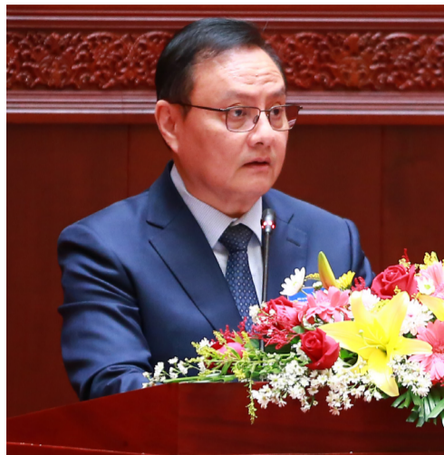
(ສພຊ) - ຕອນປາຍວັນ

ທີ 10 ທັນວານີ້, ກອງປະຊຸມ ສະໄໝສາມັນເທື່ອທີ 8 ຂອງສະ ພາແຫ່ງຊາດຊຸດທີ IX ໂດຍການ ເປັນປະທານຂອງທ່ານ ພິທ. ສຸ ວອນ ເລື່ອງບຸນມີ ຮອງປະທານ ສະພາແຫ່ງຊາດ, ທ່ານສັນຕິພາບ ພິມວິຫານ ລັດຖະມົນຕີກະຊວງ ການເງິນ ໄດ້ສະເໜີປັບປຸງກົດ ໝາຍວ່າດ້ວຍການກວດສອບ ອິດສະຫຼະ ເຊິ່ງຜ່ານການຈັດຕັ້ງ ປະຕິບັດກົດໝາຍສະບັບປີ 2014 ຍັງບໍ່ທັນກຳນົດກົນໄກການຄຸ້ມ ຄອງຊ່ຽວຊານບັນຊີ ເປັນຕົ້ນ: 1. ການອະນຸຍາດ, ໂຈະ ແລະ ຖອນໃບອະນຸຍາດການເຄື່ອນໄຫວ ຂອງຊ່ຽວຊານບັນຊີ ເພື່ອ ເປັນປ່ອນອີງໃນການຕິດຕາມ ແລະ ກວດກາການເຄື່ອນໄຫວ ຂອງຊ່ຽວຊານບັນຊີໃຫ້ຖືກ ຕ້ອງຕາມກົດໝາຍ, ມີຈັນຍາ ບັນຈັນຍາທຳ ແລະ ເປັນມີອາ ຊີບຢ່າງແທ້ຈິງ; ພ້ອມກັນນັ້ນ, ຍັງບໍ່ທັນໄດ້ກຳນົດກ່ຽວກັບຊ່ຽວ ຊານບັນຊີຕ່າງປະເທດ ທີ່ຈະມາ ເປັນຊ່ຽວຊານບັນຊີລາວ ແລະ ເຄື່ອນໄຫວປະກອບອາຊີບຢູ່ ສປປລາວ. 2. ກົດໝາຍສະບັບ ປັດຈຸບັນ ໄດ້ກຳນົດມາດຕະການ ປັບປຸງໃໝ່ໃນມາດຕາ 90 ເຊິ່ງໄດ້ ກຳນົດບັນດາລາຍການເຄື່ອນ ໄຫວທີ່ຈະຖືກປັບໃໝໃຫ້ແຕ່ລະ ພາກສ່ວນເຊັ່ນ: ສຳລັບວິສາຫະ ກິດບັນຊີແລະວິສາຫະກິດກວດ ສອບ, ນັກກວດສອບ, ຊ່ຽວຊານ