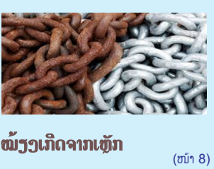
ໝັ້ນງາມເກີດຈາກເຫຼັກ (ໜ້າ 8)

ການປົກຄອງນະຄອນຫຼວງວຽງຈັນ (ນວ) ໂດຍການເປັນປະທານ ອ່ານຕໍ່ໜ້າ 7