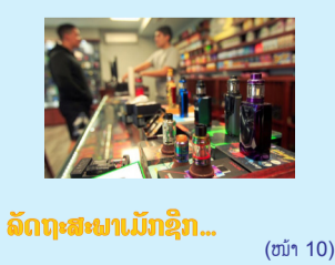
ລັດຖະສະພານມັກຊືກ... (ໜ້າ 10)