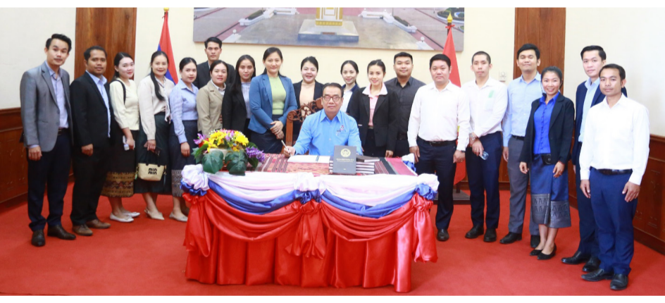
(ສພຊ) - ວັນທີ 16 ທັນ

ວາຜ່ານມາ, 3 ອົງການຈັດຕັ້ງ ມະຫາຊົນຂອງສະພາແຫ່ງຊາດ (ສພຊ) ໄດ້ຈັດຕັ້ງຂະບວນການ ທັດສະນະສຶກສາແລະທ່ຽວຊົມ ສະຖານທີ່ປະຫວັດສາດຂອງຊາດ, ຂອງພັກແລະການປະຕິວັດລາວ ໂດຍການນຳພາຂອງສະຫາຍອຳ ໄພ ຈິດມານິນ ຄະນະບໍລິຫານ ງານພັກ, ປະທານສະຫະພັນກຳ ມະບານ ສພຊ. ຂະບວນການຄັ້ງນີ້ແມ່ນ ເນື່ອງໃນໂອກາດສະເຫຼີມສະຫຼອງ ວັນຊາດທີ 2 ທັນວາ ຄົບຮອບ 49 ປີ, ວັນເກີດປະທານໄກສອນ ພິມວິຫານ ຄົບຮອບ 104 ປີ, ວັນໄຂອະນຸສອນສະຖານປະທານ