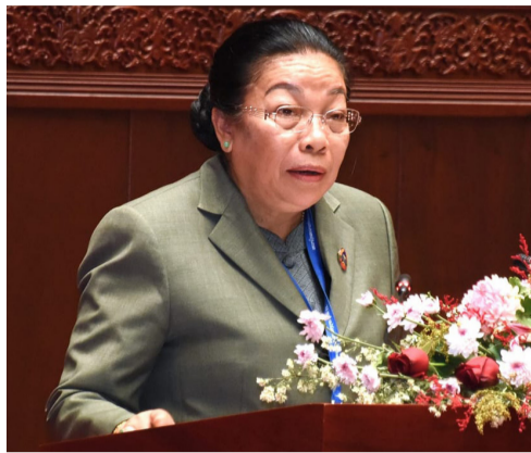
ຈັນສະໜອນ ຮອງນາຍົກລັດຖະ ມົນຕີ, ລັດຖະມົນຕີກະຊວງປ້ອງ ກັນປະເທດ ໄປປະຈຳຢູ່ສຳນັກ ງານນາຍົກລັດຖະມົນຕີໃນຖາ

(ສພຊ) - ກອງປະຊຸມ ສະໄໝສາມັນເທື່ອທີ 8 ຂອງສະ ພາແຫ່ງຊາດຊຸດທີ IX ໃນວາລະ ຕອນປາຍວັນທີ 27 ພະຈິກນີ້ ໂດຍການເປັນປະທານຂອງທ່ານ ປອ. ໄຊສົມພອນ ພົມວິຫານ ປະ ທານສະພາແຫ່ງຊາດ; ທ່ານ ປອ. ນາງ ສຸນທອນ ໄຊຍະຈັກ ຮອງ ປະທານສະພາແຫ່ງຊາດ ໄດ້ຜ່ານ ມະຕິຂອງຄະນະປະຈຳສະພາແຫ່ງ ຊາດ ວ່າດ້ວຍການຮັບຮອງເອົາ ການຍົກຍ້າຍ ແລະ ແຕ່ງຕັ້ງສະ ມາຊິກລັດຖະບານ ເຊິ່ງໄດ້ຍົກ ຍ້າຍທ່ານ ພິທ. ຈັນສະໜອນ