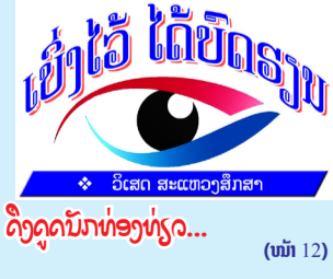
ດິງດູດນັກທ່ອງທ່ຽວ... (ໜ້າ 12)