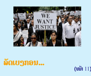
ລັດເບຽກອນ... (ໜ້າ 11)