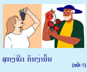
ສຸກວ່າໃດ ກິນວ່ານັ້ນ (ໜ້າ 9)