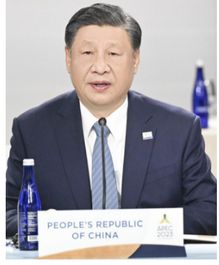
ອາຊີ-ປາຊີຟິກ ໃນໄລຍະ 30 ປີຜ່ານມາ.

ທ່ານ ສີ ຈິນຜິງ ປະທານປະເທດຈີນ ໄດ້ໃຫ້ ຂໍ້ສະເໜີ 4 ຂໍ້ ໃນບົດປາຖະກະຖາຕໍ່ກັບບັນຫາທີ່ອົງການ APEC ຈະພັດທະນາ ໃນ 3 ທິດສະວັດຄຳ ໃນຕໍ່ໜ້າວ່າ: ຍຶດໜັ້ນຖືເອົາການປະດິດສ້າງເປັນແຮງຂັບເຄື່ອນ, ຍຶດໜັ້ນ ຖືເອົາການເປີດປະຕູສູ່ພາຍນອກເປັນທິດຊື່ນຳ, ຍຶດໜັ້ນການພັດທະນາຕາມທິດສີຂຽວ, ຍຶດໜັ້ນການສ້າງຜົນປະໂຫຍດ ຢ່າງທົ່ວເຖິງ ແລະ ຊົມໃຊ້ຮ່ວມກັນ. ສ່ວນແນວຄິດທີ່ສອດຫ້ອຍຢູ່ຕະຫຼອດໃນ 4 ຂໍ້ສະເໜີດັ່ງກ່າວ ຍັງຄົງແມ່ນຍຶດໜັ້ນແນວຄິດການເປີດປະຕູສູ່ພາຍນອກ, ຮ່ວມມື ແລະ ຮ່ວມກັນສະແຫວງຫາການພັດທະນາ. ນີ້ແມ່ນພື້ນຖານແຜນການຂອງທ່ານ ສີ ຈິນຜິງ ແລະ ແມ່ນຜົນສະຫຼຸບຈາກການພັດທະນາຂອງ