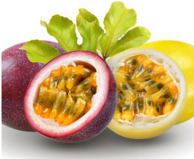
ດຽວກັນ ເພາະໝາກນອດ ອຸ ທີ່ເປັນຮໍໂມນແຫ່ງຄວາມສະດີມໄປດ້ວຍສານເຊລາໂທນິນ ຫງົບ ຊ່ວຍຄວບຄຸມອາລິມໄປ

ເຖິງແມ່ນເວລາກິນ ຈະມີລົດສົ້ມຈົນຕາຍີ່ກໍຕາມ ແຕ່ເວລາ ນອນກໍຊ່ວຍໃຫ້ນອນຫຼັບດີເຊັ່ນ