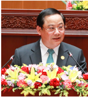
ຮັກຊາດຂອງຕົນ.

ຈາກຕ່າງປະເທດ ແນໃສ່ຄຸ້ມຄອງໃຫ້ກະແສເງິນຕາຕ່າງປະເທດເຂົ້າສູ່ລະບົບທະນາຄານໃຫ້ຫຼາຍຂຶ້ນ. ໄປຄຽງຄູ່ກັບການສົ່ງເສີມການນໍາໃຊ້ເງິນສະກຸນທ້ອງຖິ່ນ ເພື່ອສົ່ງເສີມການຊໍາລະສະສາງເຂົ້າໃນກິດຈະກໍາການຄ້າ-ການບໍລິການ ແລະ ການລົງທຶນລະຫວ່າງ ສປປ ລາວ ກັບຕ່າງປະເທດ.