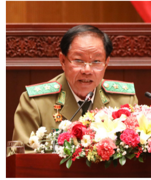
ຄວາມຮັບປະກັນຄວາມປອດໄພ.

- ຄວນກຳນົດອີກພາກ ໜຶ່ງກ່ຽວກັບການຮັບປະກັນງົບ ປະມານ ແລະ ອາວຸດຍຸດໂທ ປະກອນໃຫ້ກຳລັງປ້ອງກັນ ຄວາມສະຫງົບປະຊາຊົນ ເພື່ອ ຮອງຮັບໃນເວລາປະຕິບັດໜ້າ ທີ່ວຽກງານວິຊາສະເພາະໃຫ້ມີ