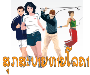
ສຸກສະບຍໂລກ

ໝາກມອນ ເປັນໝາກໄມ້ທີ່ມີປະໂຫຍດຕໍ່ສຸຂະພາບ ເພາະເປັນໝາກໄມ້ທີ່ໃຫ້ພະລັງງານຕໍ່າ ທັງມີສານອາຫານທີ່ສໍາຄັນເຊັ່ນ: ຄາໂບໄຮເດດ ແລະ ເສັ້ນໄຍທີ່ເຮັດໃຫ້ອີ່ມໄວ ນອກນີ້, ຍັງຊ່ວຍເພີ່ມພະລັງງານໃຫ້ຮ່າງກາຍອີກດ້ວຍ ນອກນັ້ນ, ຍັງຖືກຈັດເປັນໝາກໄມ້ທີ່ມີນໍ້າຫຼາຍ ເພາະ 88% ຂອງໝາກມອນແມ່ນນໍ້າ ຈຶ່ງສາມາດຊ່ວຍເພີ່ມລະດັບນໍ້າໃນຮ່າງກາຍ ແລະ ຊ່ວຍປ້ອງກັນການຂາດນໍ້າໄດ້.