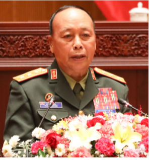
ຄວນກຳນົດເຂົ້າໃນກົດໝາຍ ຫຼື ບໍ່.

- ການແຕ່ງຕັ້ງ, ຍົກຍ້າຍ ຫຼື ປົດຕຳແໜ່ງ, ການເລື່ອນຊັ້ນ ແລະ ການປະຕິບັດນະໂຍບາຍ ໃຫ້ນາຍທະຫານ ໄປປະຈຳການ ຢູ່ ກຳມາທິການ ປກຊ-ປກສ ສະພາແຫ່ງຊາດ, ສະພາປະຊາ ຊົນຂັ້ນແຂວງ, ຫ້ອງການ ປກຊ- ປກສ, ສະຫະພັນນັກຮີບເກົ້າ ແຕ່ສູນກາງລົງຮອດທ້ອງຖິ່ນ