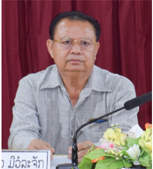
ນິມິດລະຈັກ

(ສພຊ) ເພື່ອເປັນການຍົກສູງການປະຕິບັດພາລະບົດບາດ, ສິດ ແລະ ໜ້າທີ່ຂອງບັນດາທ່ານສະມາຊິກສະພາປະຊາຊົນແຂວງ ໃຫ້ມີຄວາມຮັບຮູ້, ເຂົ້າໃຈ ແລະ ກຳໄດ້ວຽກງານການກວດສອບ ຮັບປະກັນໃຫ້ການຈັດຕັ້ງປະຕິບັດເຂົ້າໃນວຽກງານຕົວຈິງ ໃຫ້ມີປະສິດທິພາບ ແລະ ປະສິດທິຜົນດີຂຶ້ນເປັນກ້າວໆ, ສະພາປະຊາຊົນແຂວງ ແມ່ນອົງການອຳນາດລັດຂັ້ນທ້ອງຖິ່ນທີ່ປະຕິບັດຕາມ 3 ພາລະບົດບາດຕົ້ນຕໍຄື: ດ້ານນິຕິບັນຍັດ ແມ່ນສ້າງ ແລະ ປັບປຸງນິຕິກຳໃຫ້ກົດໝາຍ, ດ້ານການຕົກລົງບັນຫາພື້ນຖານສຳຄັນຂອງແຂວງ ເປັນຕົ້ນແມ່ນແຜນພັດທະນາເສດຖະກິດ-ສັງຄົມ, ແຜນງົບປະມານແຫ່ງລັດຂອງແຂວງ ແລະ ດ້ານການຕິດຕາມກວດກາການຈັດຕັ້ງປະຕິບັດລັດຖະທຳມະນູນ, ກົດໝາຍໃນການຄຸ້ມຄອງລັດ, ຄຸ້ມຄອງສັງຄົມພາຍໃນແຂວງ ໃນນັ້ນ, ວຽກງານກວດສອບ ກໍເປັນວຽກງານໜຶ່ງທີ່ສຳຄັນ ເຊິ່ງສະພາປະ