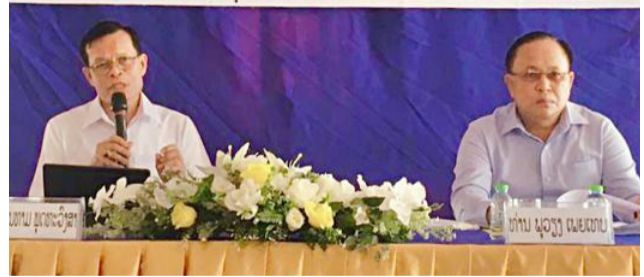
ແລະ ສະພາປະຊາຊົນ ນະຄອນຫຼວງວຽງຈັນ ຊຸດທີ II

(ສພຊ) ໃນຕອນເຊົ້າຂອງວັນທີ 23 ສິງຫານີ້, ສະມາຊິກສະພາແຫ່ງຊາດ (ສສຊ) ປະຈຳເຂດເລືອກຕັ້ງທີ 1 ນະຄອນຫຼວງວຽງຈັນ (ນວ) ແລະ ສະມາຊິກສະພາປະຊາຊົນນະຄອນຫຼວງວຽງຈັນ (ສສນວ) ໄດ້ເຄື່ອນໄຫວພົບປະຜູ້ມີສິດເລືອກຕັ້ງ ແລະ ເຜີຍແຜ່ຜົນສໍາເລັດກອງປະຊຸມສະໄໝສາມັນ