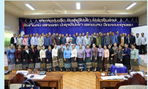
ສະມາຊິກສະພາ... (ໜ້າ 4)