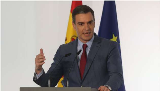
ຍຸບສະພາ ເພື່ອເປີດທາງໃຫ້ມີ ນິດໃນວັນທີ 23 ກໍລະກົດນີ້. ການເລືອກຕັ້ງທົ່ວໄປກ່ອນກຳ ການຕັດສິນໃຈດັ່ງກ່າວ

ມີຂຶ້ນຫຼັງຈາກພັກລັດຖະບານ PSOE ຂອງທ່ານ ເປໂດຣ ຊານ ເຊ ແລະ ພັກພັນທະມິດ ເສຍ ໄຊການເລືອກຕັ້ງທ້ອງຖິ່ນ ແລະ ການເລືອກຕັ້ງລະດັບທ້ອງຖິ່ນ ທີ່ຈັດຂຶ້ນໃນວັນທີ 28 ພຶດສະ ພາ. ຂະນະທີ່ພັກຂວາຈັດ ຄື ພັກຄອນເຊີເວທິບພິເລີ ແລະ ພັກ Vox ສ້າງຜົນງານໃນການ ເລືອກຕັ້ງໄດ້ຫຼາຍກວ່າ.