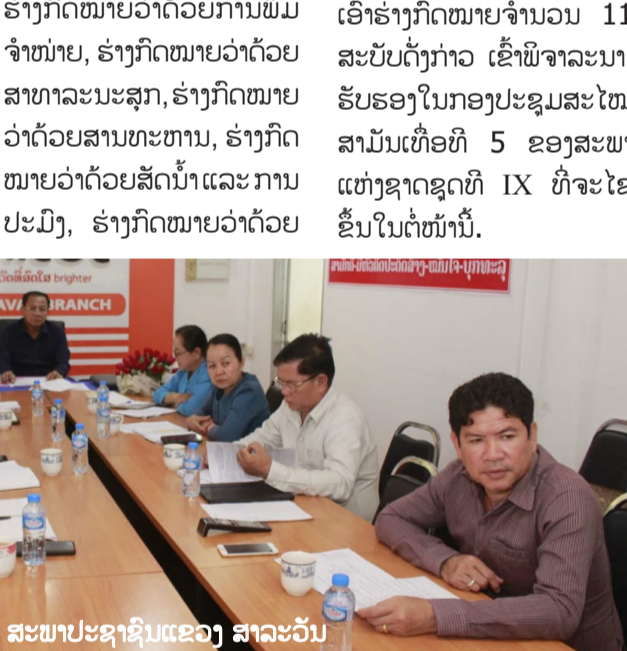
ສະພາປະຊາຊົນແຂວງ ສາລະວັນ