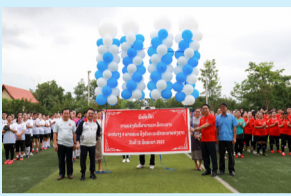
ກິລາບອນເຕະມິດຕະພາບ... (ໜ້າ 2)