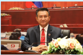
ຜົນສໍາເລັດຫຼາຍດ້ານ... (ໜ້າ 6)