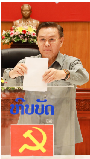
ຜູ້ແທນກອງປະຊຸມຍັງໄດ້ທາບທາມຄວາມໄວ້ວາງໃຈຕໍ່ການ

ບັນດາມະຕິ, ຄໍາສັ່ງ ແລະ ເອກະສານສໍາຄັນຕ່າງໆຂອງພັກ, ການນໍາພາດ້ານການເມືອງ-ແນວຄິດ, ການກໍ່ສ້າງພັກ-ພະນັກງານ, ປັບປຸງກົງຈັກການຈັດຕັ້ງ, ແບບແຜນການນໍາພາ ແລະ ວິທີເຮັດວຽກ, ນໍາພາອົງການຈັດຕັ້ງມະຫາຊົນ, ວຽກງານການເຄື່ອນໄຫວຕ່າງປະເທດ, ວຽກງານກວດກາ ແລະ ປ້ອງກັນພາຍໃນ ແລະ ອື່ນໆ; ນອກຈາກນີ້,