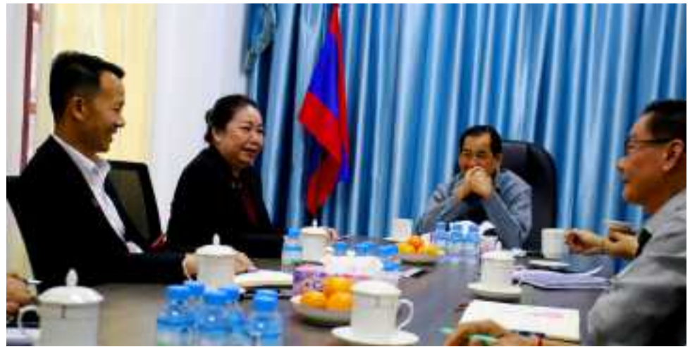
ທ່ານ ນາງ ພອນທິບ ສາວະລີ ໄດ້ລາຍງານຈຸດປະສົງຂອງການມາເຄື່ອນໄຫວວຽກງານຢູ່ແຂວງບໍລິຄຳໄຊ ເປັນຕົ້ນແມ່ນການລົງມາຊຸກຍູ້, ຕິດຕາມ ແລະ ວຽກງານກວດກາ

(ສພຊ) ໃນຕອນເຊົ້າວັນທີ 24 ເມສາ 2023 ຢູ່ສະພາປະຊາຊົນແຂວງບໍລິຄຳໄຊ, ທ່ານ ປອ. ສຸວັນນີ ໄຊຊະນະ ປະທານສະພາປະຊາຊົນແຂວງບໍລິຄຳໄຊ ພ້ອມດ້ວຍຄະນະໄດ້ຕ້ອນຮັບຄະນະຂອງທ່ານ ນາງ ພອນທິບ ສາວະລີ ຫົວໜ້າກົມກວດກາ, ອົງການໄອຍະການປະຊາຊົນສູງສຸດ ໃນໂອກາດທີ່ມາເຄື່ອນໄຫວຊຸກຍູ້ວຽກງານສະເພາະດ້ານຢູ່ແຂວງບໍລິຄຳໄຊ.