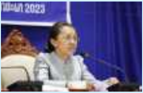
ສພຊ ອັດຕະປື ທາບທາມ... (ໜ້າ 7)