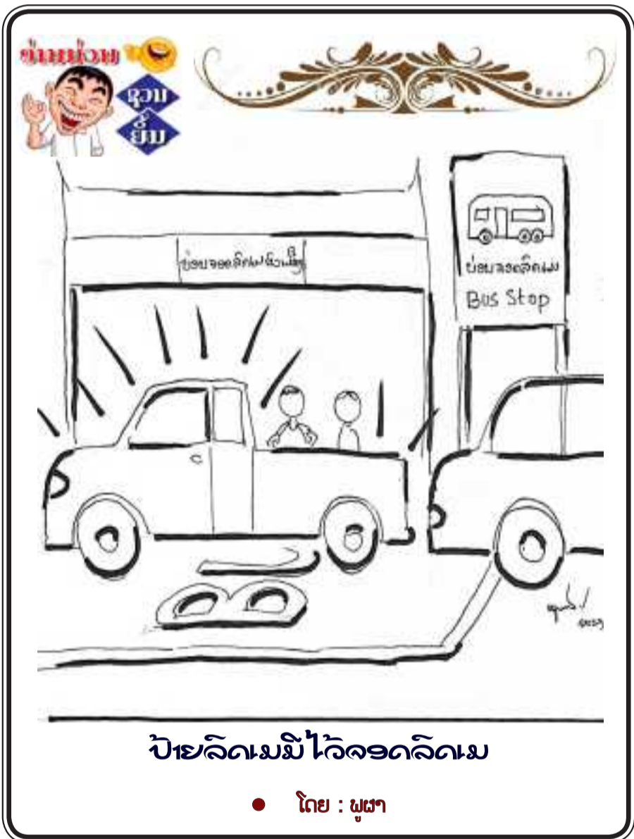
ບ້ອນລອດເມນີ ໄວ້ລອດລິດເມ

A pipe burst in a doctor's house. He called a plumber. The plumber arrived, unpacked his tool, did plumber-type things for a while, and handed the doctor a bill for 600$. The doctor exclaimed, " This is ridiculous !. I don't even make that much as a doctor !" The plumber quietly answered, "Neither did I when I was a doctor".