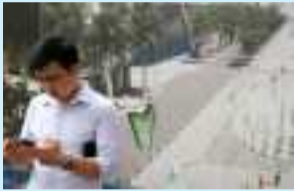
ທວຽດນາມ ກະກຽມກິດໝາຍ... (ໜ້າ 11)