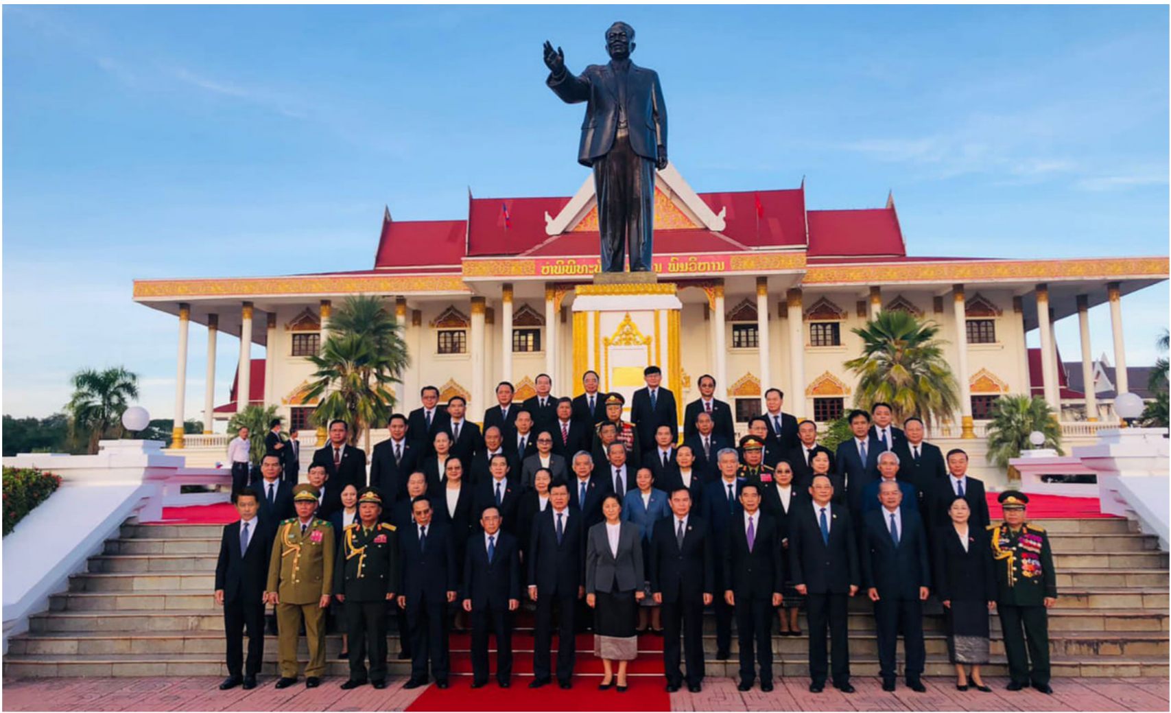
ພາຂອງພັກປະຊາຊົນປະຕິວັດລາວ ຈົນສາມາດຍາດໄດ້ໄຊຊະນະອັນໃຫຍ່ຫລວງ ແລະ ປະກາດເອກະລາດ, ສະຖາປະນາເປັນສາທາລະນະລັດ ປະຊາທິ

ການວາງພວງມາລາໃນຄັ້ງນີ້, ແມ່ນເພື່ອເປັນການສະແດງຄວາມເຄົາລົບຮັກ, ຄວາມກະຕັນຍູຮູ້ບຸນຄຸນເຖິງຄຸນງາມຄວາມດີ, ນ້ຳໃຈຕໍ່ສູ້ຢ່າງພິລະອາດຫານ ແລະ ບໍ່ຍອມຈຳນົນຂອງບັນຜະບູລຸດລາວ ກໍຄືບັນດານັກຮີບປະຕິວັດ ທີ່ໄດ້ເສຍສະຫລະຊີວິດ, ເລືອດເນື້ອເພື່ອຜາລະກິດປະຕິວັດຢ່າງອົງອາດກ້າຫານພາຍໃຕ້ການຊີ້ນຳ-ນຳ