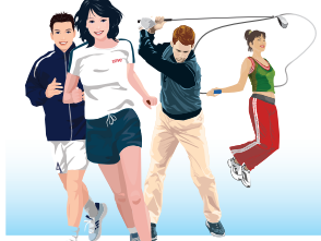
ສຸກສະບາຍຫາຍໄອຄາ

ພຽງພໍ ຫລື ອາດຈະກິນເກີນຄວາມຕ້ອງການຂອງຮ່າງກາຍ ເປັນອີກໜຶ່ງພິດຕິກຳ ທີ່ພະນັກງານຫ້ອງການມັກຈະເຮັດ ຈຶ່ງຜາໃຫ້ກະເພາະເຮັດວຽກໄດ້ບໍ່ປົກກະຕິ. 3. ຕິດຈໍມືຖື ຢູ່ໜ້າຈໍຄອມພິວເຕີ ຫລື ຈໍມືຖືຫລາຍເກີນໄປ ມັນເປັນໄພຂົ່ມຂູ່ທີ່ງຽບ ທີ່ຜາໃຫ້ເກີດການເຈັບຫົວ ຫລື ເຮັດໃຫ້ຕາວຸ່ນເສື່ອມສະພາບ ແລະ ຍັງສາມາດສົ່ງຜົນໃຫ້ນິ້ວມືລັອກນຳອີກ. 4. ພາຍຖົງໜັກ. ພິດຕິກຳນີ້ສາມາດເຮັດໃຫ້ເກີດການປວດປາ, ເຈັບຄໍ ແລະ ສາມາດລາມໄປສູ່ການເຈັບຫົວ ແລະ ເຈັບຫລັງ ເຊິ່ງເປັນສາເຫດຂອງການຍຸບ ແລະ ການເສື່ອມ ຂອງກະດູກສັນຫລັງ ຈົນເກີດເປັນຄວາມສ່ຽງທີ່ເຮັດໃຫ້ກະດູກທັບເສັ້ນປະສາດ ລວມທັງເຮັດໃຫ້ເກີດອາການແຂນຂາມືນຊາ ແລະ ອ່ອນເພຍ. 5. ນັ່ງຜິດທ່າ ອາດຈະເປັນຍ້ອນນິໄສ ຫລື ຍ້ອນຮູ້ສຶກສະດວກສະບາຍ ກັບທ່ານັ່ງທີ່ບໍ່ຖືກຕ້ອງ ແຕ່ຖ້ານັ່ງຜິດທ່າເປັນເວ