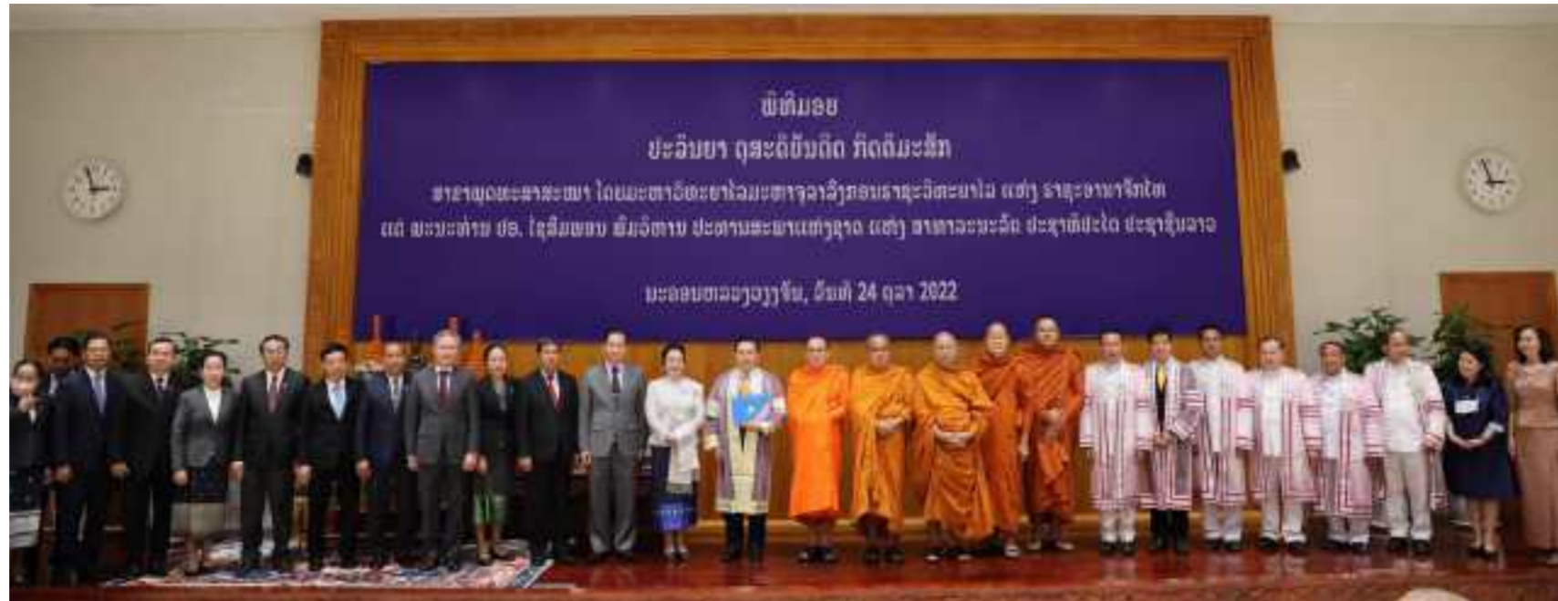
ມາແຕ່ຕົກດໍາບັນ ຫລື ນັບແຕ່ເສັດຕະວັດທີ 14 ເປັນຕົ້ນມາ, ພະສົງ-ສາມະເນນ ເຄີຍມີມູນເຊື້ອຕິດພັນກັບຊາດຕິດພັນກັບປະຊາຊົນລາວບັນດາເຜົ່າ ເຊິ່ງມີພາລະໜ້າທີ່ໃນການນໍາເອົາຫລັກສິນທໍາ ຈະລິຍະທໍາອັນດີງາມໄປເຜີຍແຜ່ເທທດສະໜາສິ່ງສອນ, ສຶກ

ສາສະໜາພຸດ ເປັນສາສະໜາທີ່ຕິດພັນກັບອິດທິພົນຂອງປະເພນີ ແລະ ວັດທະນະທໍາອັນດີງາມ ຂອງຊາດລາວ