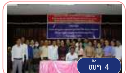
ອ່ານຕໍ່ໜ້າ 2

15 ຫົວເລື່ອງ ລວມມີ 25 ຊຸດ ໃຫ້ສະພາແຫ່ງຊາດ ເພື່ອນຳໃຊ້ເຂົ້າໃນ