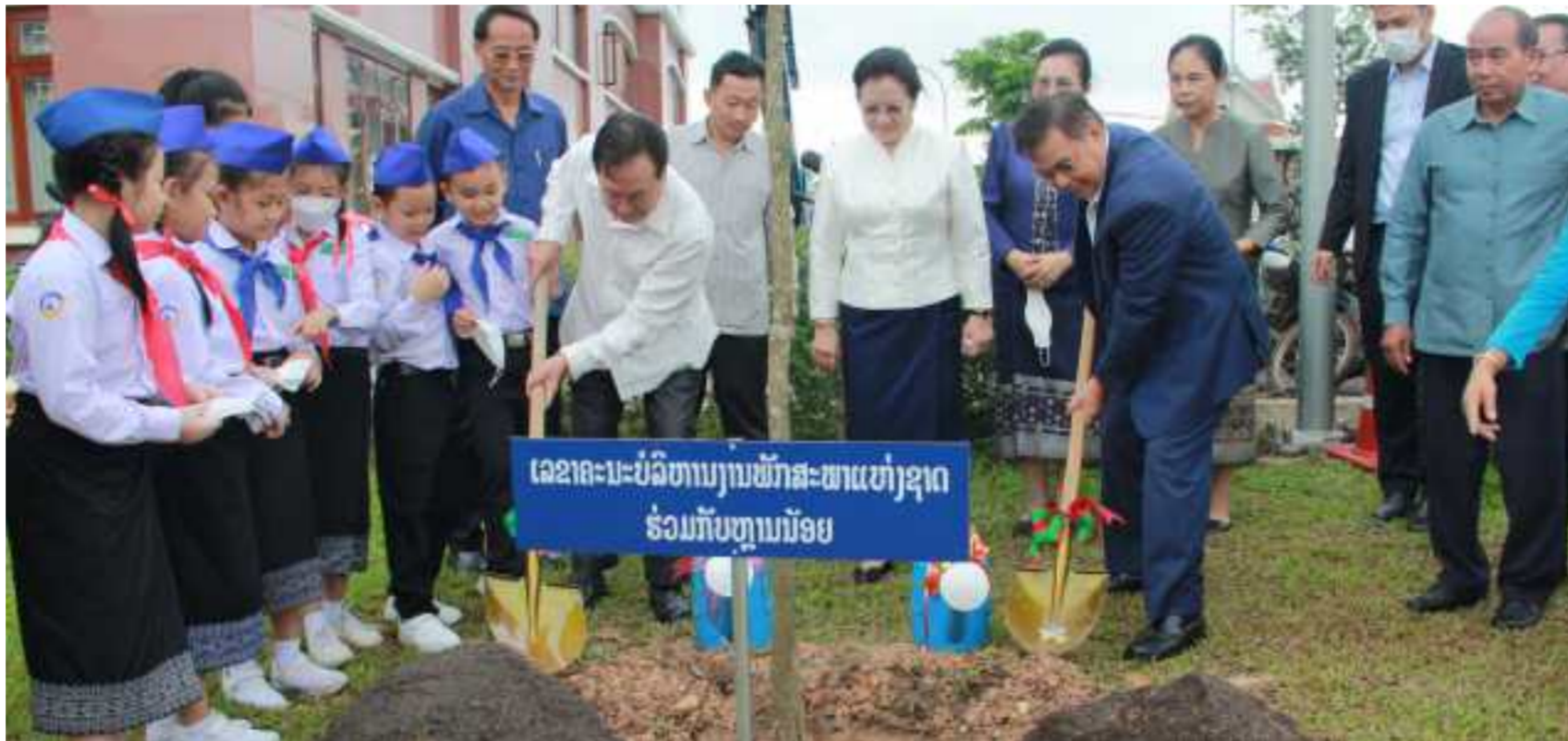
ເຍຍປາວເຮີ ຄະນະບໍລິຫານງານສູນຄະນະບໍລິຫານງານສະຫະພັນແມ່ຍິງ ວ່າ: ການສະເຫລີມສະຫລອງວັນເດັກສາກົນ 1 ມິຖຸນາໃນແຕ່ລະປີ ເປັນທວນຄືນການຈັດຕັ້ງປະຕິບັດແນວ

(ສພຊ) ສາມອົງການຈັດຕັ້ງມະຫາຊົນຂອງສະພາແຫ່ງຊາດ ຮ່ວມກັບຄະນະຮັບຜິດຊອບກອງທຶນຊ່ວຍເຫລືອສັງຄົມສະພາແຫ່ງຊາດ ຈັດພິທີສະເຫລີມສະຫລອງວັນເດັກນ້ອຍສາກົນ ຄົບຮອບ 72 ປີ (01/6/1950-01/6/2022) ແລະ ວັນປຸກຕົ້ນໄມ້ແຫ່ງຊາດ ຄົບຮອບ 42 ປີ (01/6/1980-01/6/2022) ໃນວັນທີ 31 ພຶດສະພານີ້, ທີ່ສະພາແຫ່ງຊາດ ໂດຍການເຂົ້າຮ່ວມຂອງທ່ານ ປອ. ໄຊສົມພອນ ພິມວິຫານ ປະທານສະພາແຫ່ງຊາດ ພ້ອມດ້ວຍບັນດາຄະນະນໍາຂອງສະພາແຫ່ງຊາດ ແລະ ລູກຫລານຂອງບັນດາພະນັກງານ-ລັດຖະກອນ ພາຍໃນສະພາແຫ່ງຊາດ ແລະ ພາກສ່ວນກ່ຽວຂ້ອງເຂົ້າຮ່ວມ.