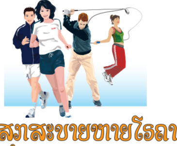
ສຸກສະບາຍຫາຍໂຮດາ

ຄາຊຸນເຄືອງໜອງ ເລັ່ງແລດົງຍູ່ ຫລາຍມີປະກອບສ່ວນ ຄາສິ້ນສ່ວນກະທໍາ ນັ້ນນາ! ມົວນັ່ງນອນເສີຍ ບໍ່ເປັນຕີ! ອ່ານໄຂວິທີແກ້ ລະດົມຄົນຂະບວນເຄື່ອນ ຄົນໜ້ອຍບໍ່ຫອນເປັນ ຊິ້ນແລ! ວອນວ່າວາງໄຂ ຈິງແລ້ວ ທ່ຽງທົນສະເໝີແທ້ ມະຫາສານສຸມໃສ່ ໃນສິ້ນສ່ວນບໍ່ດີ ຊິ້ນຕວ່າ ກໍາລັງໃຫຍ່ມະຫາສານ ເຮົານີ້! ເປັ່ງແປວໄຟແຈ້ງ ຄວາມຫວັງສັງຄົມໃໝ່ ທາງຮູ້ຮ່ອມເດີນ ເທາະນາ! ຊູໃສວິຊາການ ຍຸກນີ້ ຮ່ວມແຮງໂຮມເຮົາ ຄຸງເຄືອງຄາຍາກ ຂານເຂົ້າເຄື່ອນຂະບວນ ແທ້ເນີ!